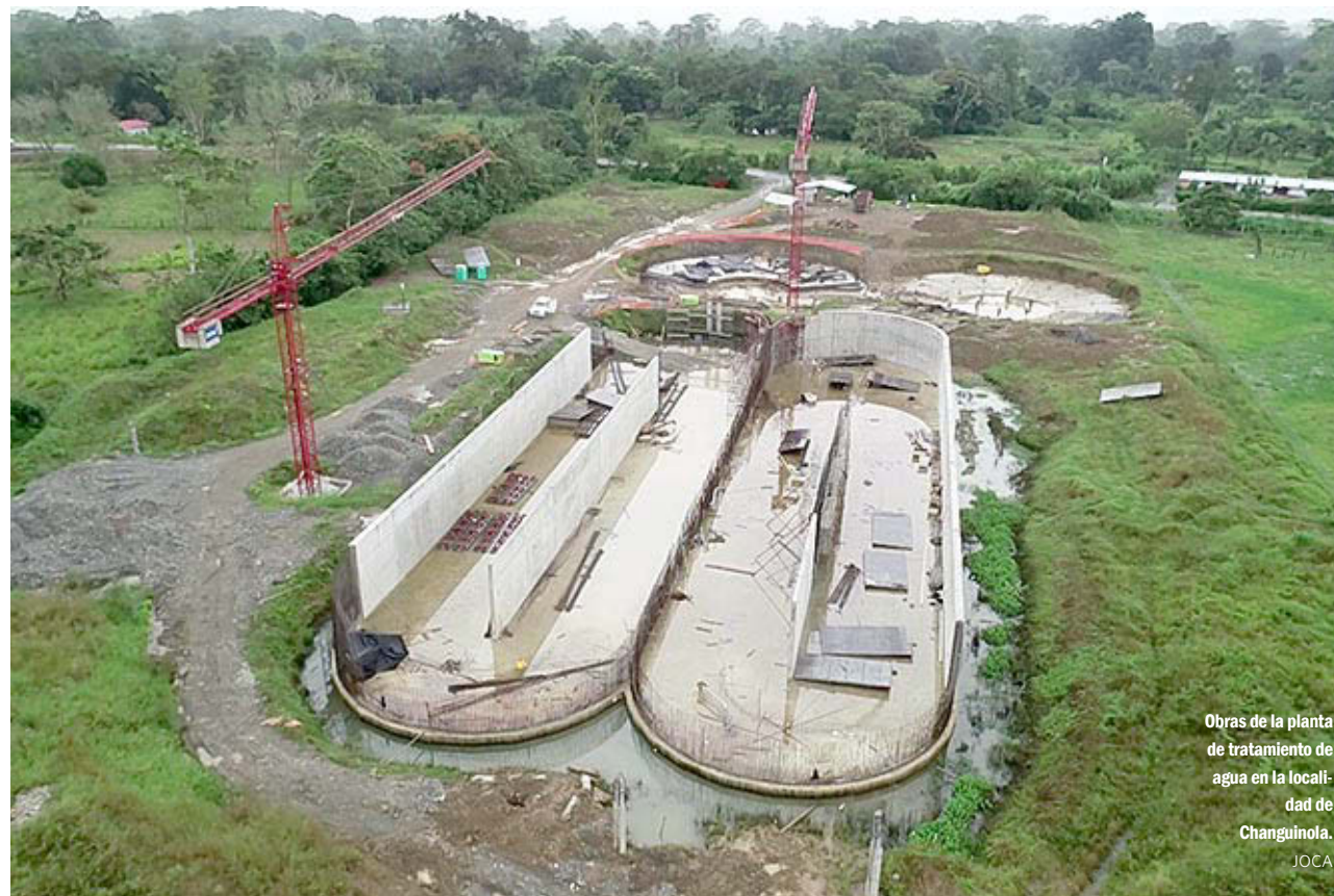
Obras de la planta de tratamiento de agua en la localidad de Changuinola.